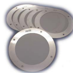
濾過フィルター群