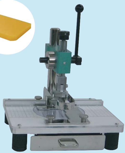
Model : SC-130C コーナーR刃タイプ