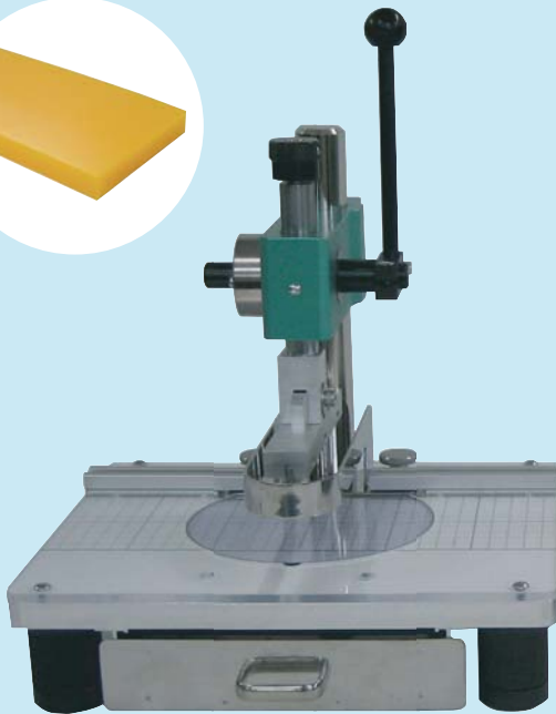
Model : SC-130B ストレート刃タイプ